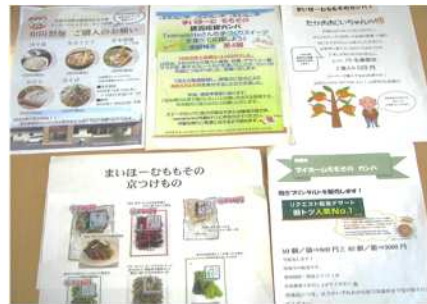
各職場企画の様々なチラシの一部