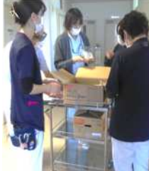
栄養課・師長・事務長室の カレーカンパ